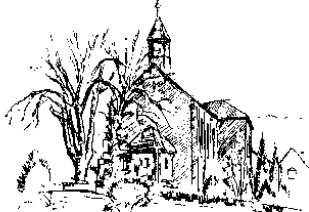
St. Franz von Sales, Kandern