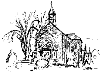
St. Franz von Sales, Kandern